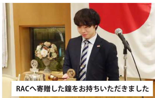
RACへ寄贈した鐘をお持ちいただきました