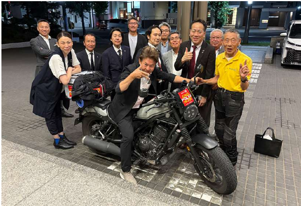
例会後、故金様と記念撮影をいたしました。