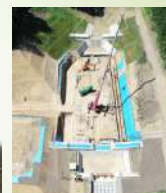
砂防ダム（札幌市清田区）