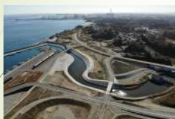
道路新設（福島県相馬郡新地町）