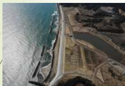
防潮堤（福島県相馬郡新地町）