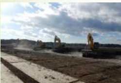
河川堤防強化（北広島市）