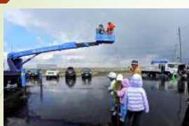
建設作業車運転体験(高圧作業車)