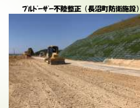
ブルドーザー不陸整正（長沼町防衛施設）