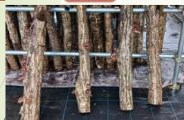
原木シイタケ栽培