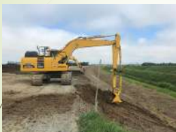
ハワーショベル掘削（千歳市）