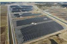
メガソーラー（福島県南相馬市小高）