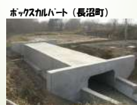
ボックスカルバート（長沼町）