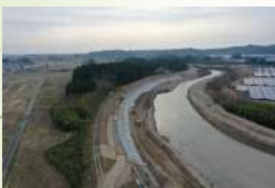
河川改修（福島県南相馬市）