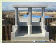
樋門（福島県南相馬市小高）