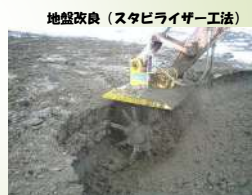
地盤改良（スタビライザー工法）