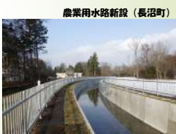
農業用水路新設（長沼町）