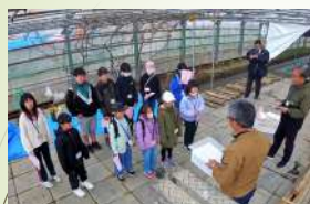
シイタケ原木菌打ち体験