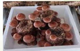
菌床シイタケ栽培