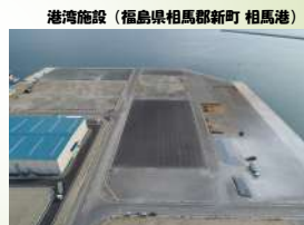
港湾施設（福島県相馬郡新地町 相馬港）