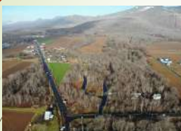
リゾート分譲地造成（ニセコ町管轄）