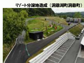
リゾート分譲地造成（洞爺湖町洞爺町）