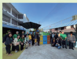
リサイクルボックス