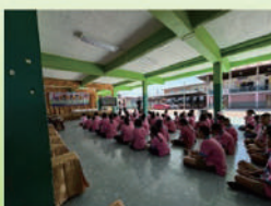
ウィエンクック学校