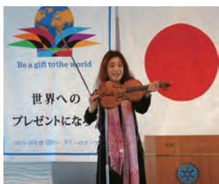
例会ではミニコンサートも