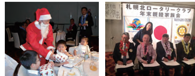
クリスマス家族会