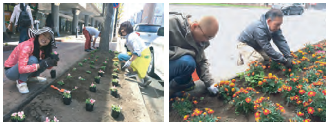
札幌駅前花壇の花植え 定期的に雑草取りもおこなっています