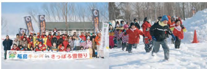
福島キッズinさっぽろ雪祭り 被災地と札幌の子供たちが雪遊びで交流