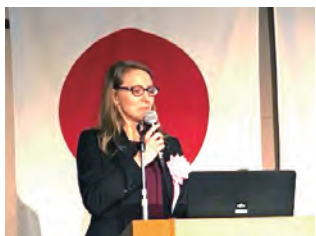
多彩なゲストの卓話