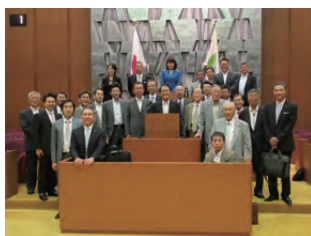
移動例会 札幌市議会議場