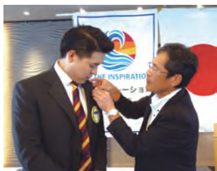
新会員入会式 会員の証、ロータリーバッジ授与