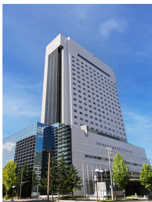
例会場 グランドメルキュール札幌大通公園