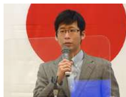
地区補助金奨学生 覚知様