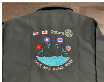
現地で刺繍が施されたジャンパー