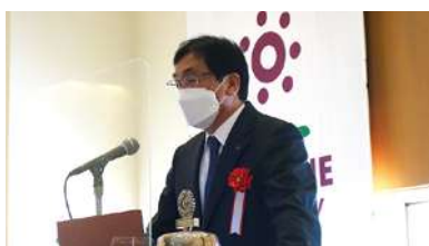
古野ガバナー補佐