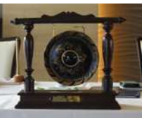
ウィワットパストガバナーより