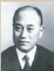
「自分がしてほしいことを人にもせよ。」 米山梅吉

日本のロータリークラブは、ロータリー財団への貢献が抜群であるだけでなく、日本独自の米山記念奨学財団を持ち、外国からの留学生に対して国内最大規模の奨学事業を展開しています。米山記念奨学生は1954年以來、2017年現在まで累計で19,808人、その出身国は世界125の国と地域に及びます。