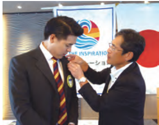
新会員入会式 会員の証、ロータリーバッジ授与