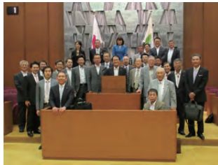
移動例会 札幌市議会議場