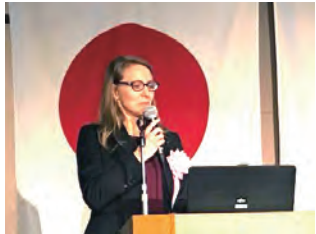
多彩なゲストの卓話