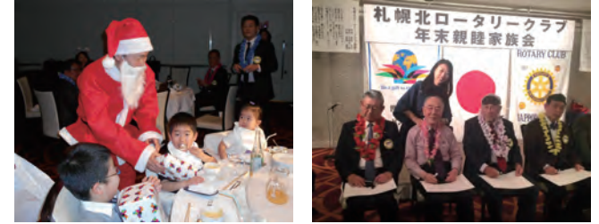
クリスマス家族会