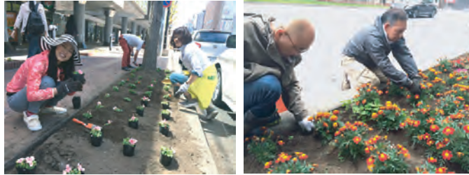
札幌駅前花壇の花植え 定期的に雑草取りもおこなっています