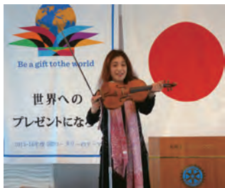
例会ではミニコンサートも