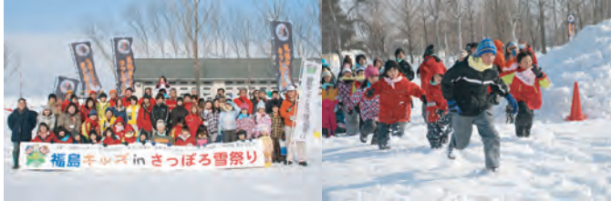
福島キッズinさっぽろ雪祭り 被災地と札幌の子供たちが雪遊びで交流