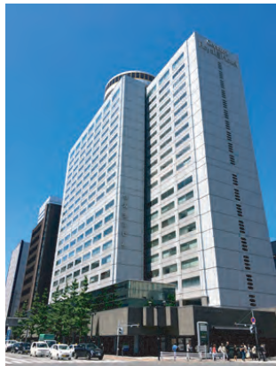
例会場 センチュリーロイヤルホテル